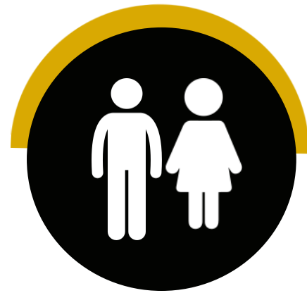
Distribución de los fallecidos por la DANA en Valencia según grupo de edad ( Datos El País )