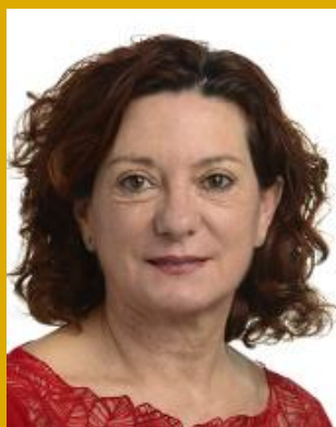
Estrella DURÁ FERRANDIS

Grupo de la Alianza Progresista de Socialistas y Demócratas en el Parlamento Europeo