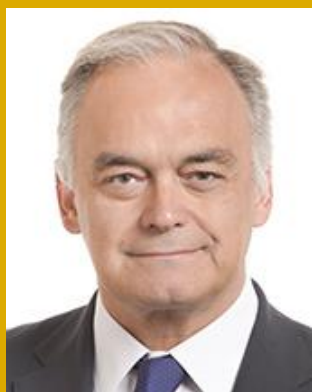
Esteban GONZÁLEZ PONS

Grupo del Partido Popular Europeo (Demócrata-Cristianos)