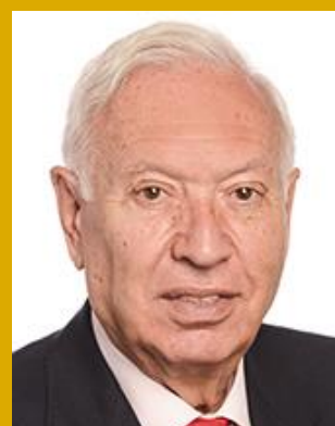
José Manuel GARCÍA-MARGALLO Y MARFIL

Grupo del Partido Popular Europeo (Demócrata-Cristianos)