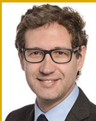
Domènec RUIZ DEVESA

Grupo de la Alianza Progresista de Socialistas y Demócratas en el Parlamento Europeo