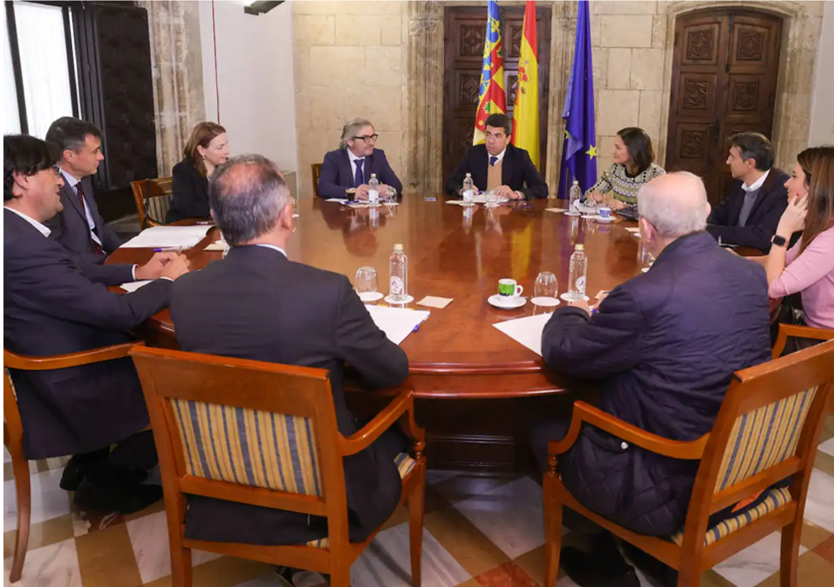
Presentación del documento de necesidades hídricas para la Comunitat Valenciana de CEV al president de la Generalitat.