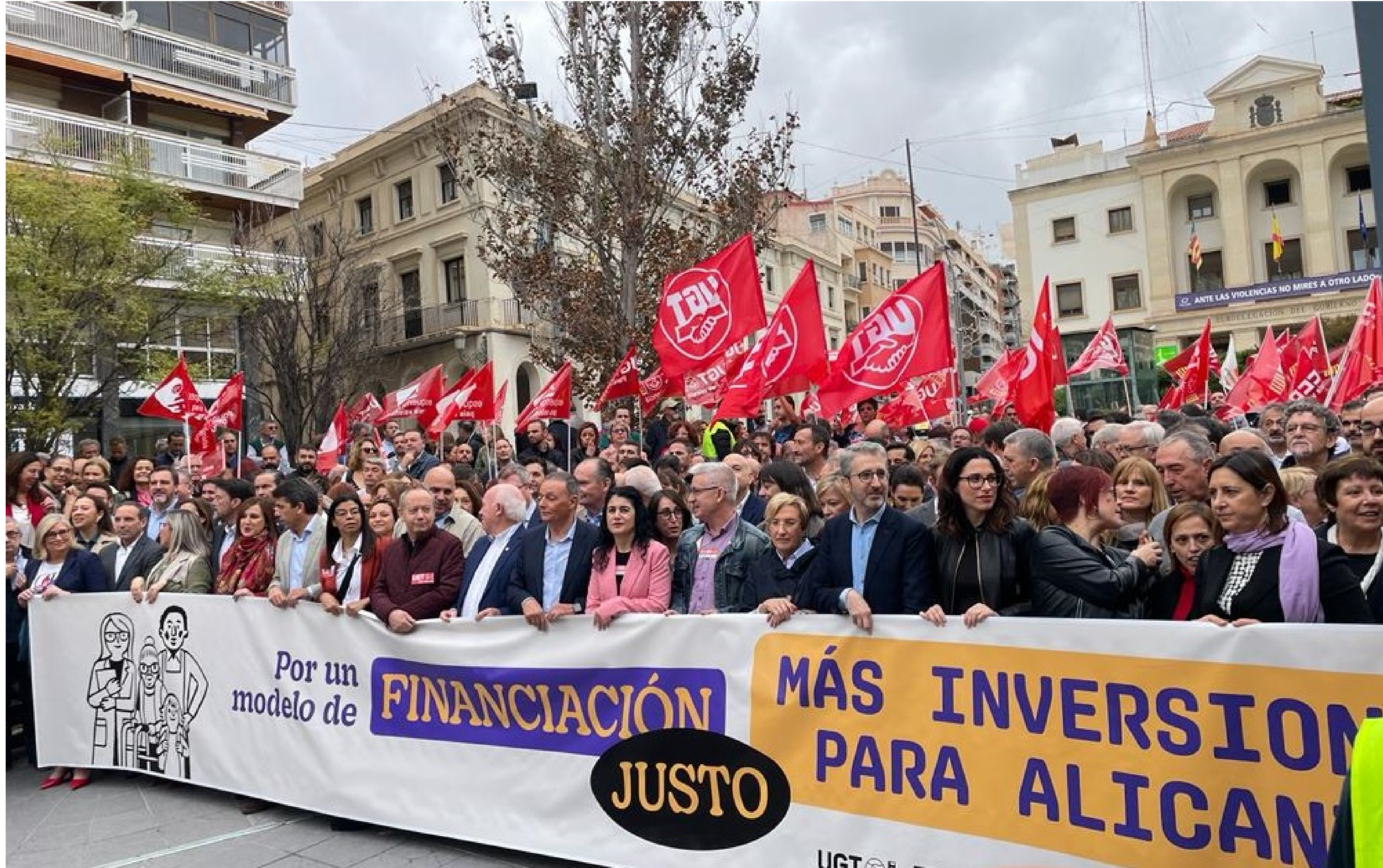
Concentración de la Plataforma Financiamiento Justo para exigir más inversiones para la provincia de Alicante y un nuevo modelo de financiación autonómica para la Comunitat Valenciana.